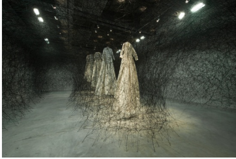
After the dream Maison Rouge 2011 Copyright Chiharu Shiota