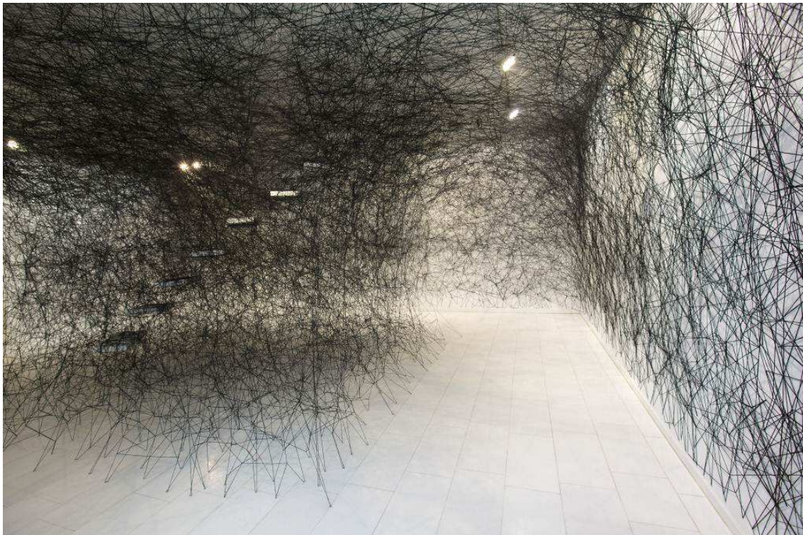
chlesweg-Holsteinischen Kunstvereins in der Kunsthalle zu Kiel // Stear way

La Sucrière - Lyon Du 4 mai au 31 juillet 2012