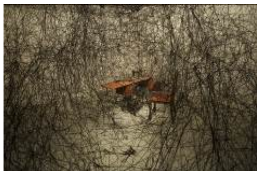
Unconscious Anxiety, 2009 // Shiseido Gallery, Tokyo

Artiste japonaise, née en 1972 et établie à Berlin depuis 1996, Chiharu Shiota est connue pour créer des environnements poétiques, monumentaux et délicats. Son travail se caractérise par un mélange de performances artistiques et d'installations spectaculaires pour lesquelles elle utilise de vieux objets (lits, pianos, etc.) autour desquels elle tisse un véritable réseau complexe et impénétrable, généralement en cordelette noire, mais parfois aussi rouge. Elle explore ainsi les relations entre passé et présent. La simplicité des matériaux rend d'autant plus fort l'impact des œuvres.