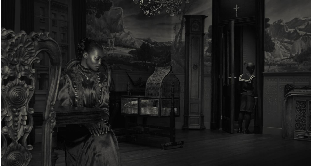
« Dusk », photographie, 2009